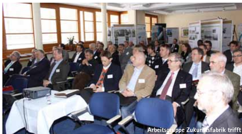
Arbeitsgruppe Zukunftsfabrik trifft