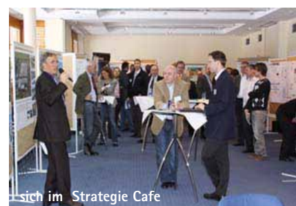
sich im Strategie Cafe